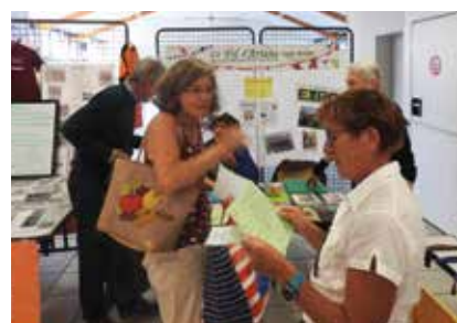
«Le Fil d'Ariane» Association culturelle.