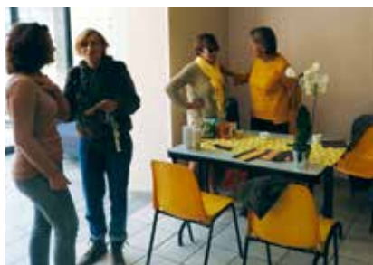
«Association sac Ados» Thérapie de famille.