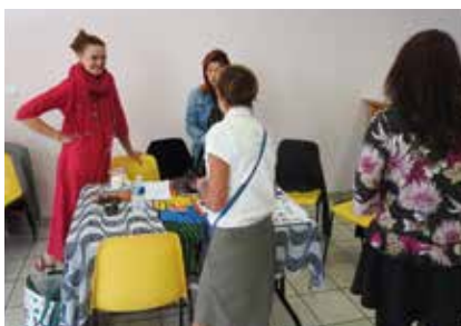
«Quiétude» Association de pratique du Yoga.