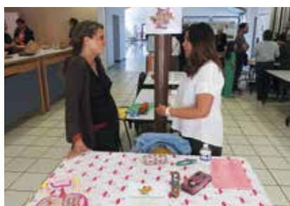
«La Compagnie Ouistiti».