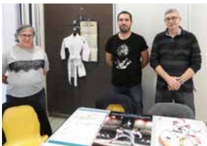
« Le karaté Do Nippon».