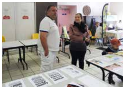
«Le Sou des Ecoles».