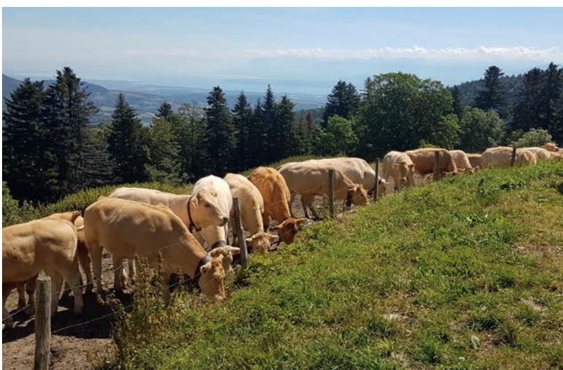
dans le Jura

Dès fin mai, différents lots de vaches et génisses sont réparties dans plusieurs alpages. Il est alors temps de faire les foins qui constitueront la nourriture de l'hiver.