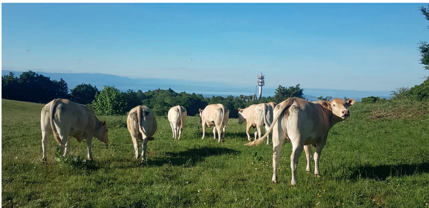
Sur le Salève