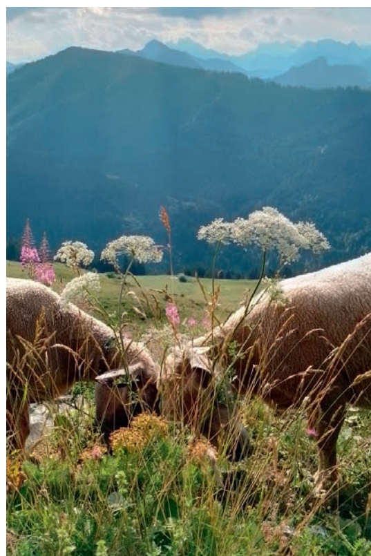
à la pointe d'Uble